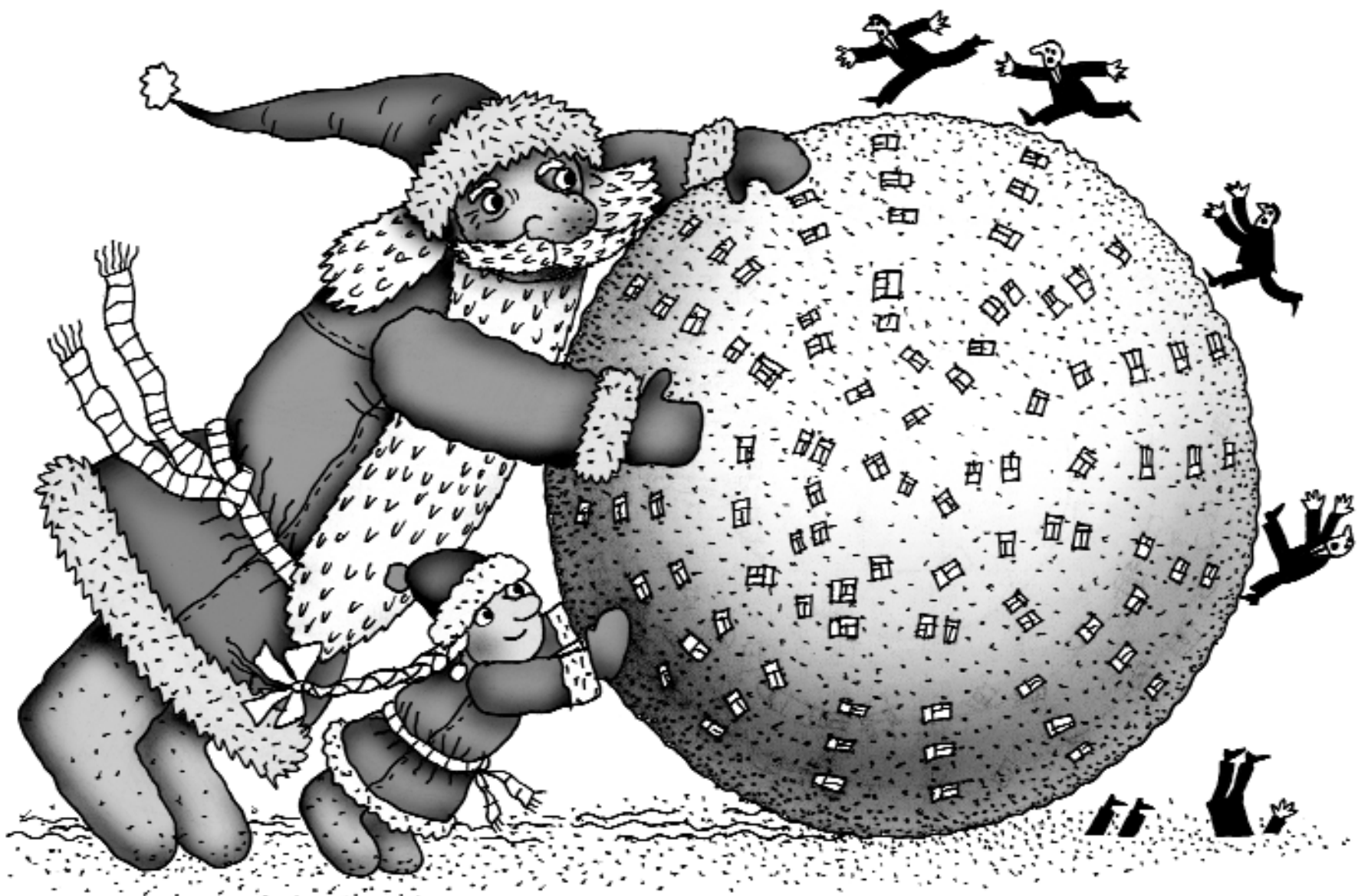
Рисунок Георгия Мурышкина

А теперь – небольшое пояснение. Если вы успели заметить, из «шапки» «Моспроектовца» исчезло имя Москомархитектуры. И это не случайно. Традиционно, с 1957 года, наша газета издавалась от имени бывшего ГЛАВАПУ (МКА) и Союза московских архитекторов, то есть при участии и помощи этих организаций. Но по факту в настоящее время они не имеют к ней отношения – ни финансово, ни информационно. Более того, мы считаем, что должны, обязаны говорить правду от лица проектировщиков, а не власти. Для этого и нужна независимая профессиональная печать. Тем более, что «Моспроектовец» «не прогибался под изменчивый мир» даже в «партийные» времена, когда любое издание могло существовать только под эгидой парткомов, месткомов и иже с ними. Надо отдать должное прежним главным архитекторам Москвы – они не считали для себя зазорным выступать на страницах нашей газеты, а наоборот, поддерживали ее, несмотря на ее «острый язык» и своеволие. Они, как и всякий прогрессивный «монарх», понимали, что альтернативное мнение и критика снизу не уронят их высокую честь, а будут помогать свести (то есть строить) разумное, доброе, вечное.